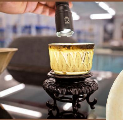
色澤綠黃、晶瑩潤澤的瓷碗，與唐代法門寺出土的秘色瓷十分相像。