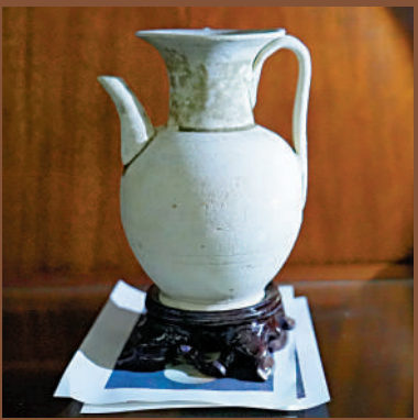
青白釉瓜棱執壺是宋代流行的器形，外觀與宋代景德鎮生產的執壺相似。