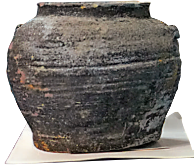
宋代瓷器在世界歷史上有重要地位。