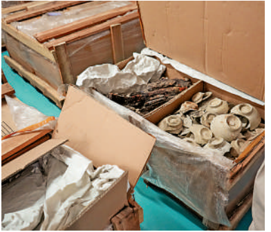
不少瓷器至今仍未開箱。