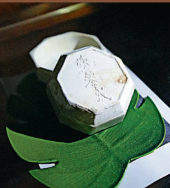
器底押印「陳家合子記」款識的粉盒。