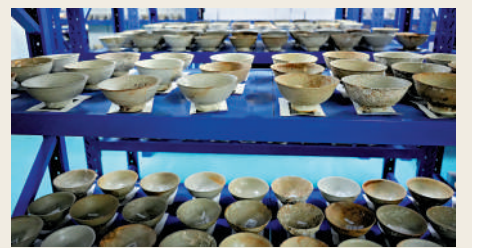
滿目的陶瓷器鱗次櫛比地陳列在一排排鐵櫃上。