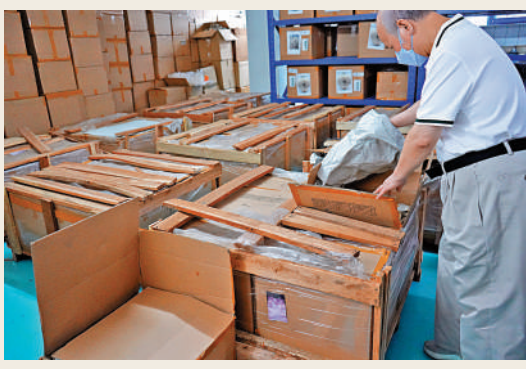
文物來港已有五年之久。