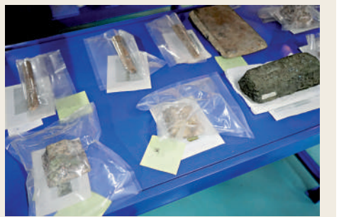
東南亞國家的古錢幣印證了北宋海上貿易之發達。